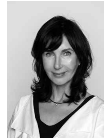
Autoriai „Habitat – interjero dizaino studija, Irena Vanagaiytė–Jankavičienė Plotas 80 m 2 Nuotraukos Luko Mykolaičio Tekstą parengė Gytautė Ivanauskaitė

jantys dusli žali ir prigesinti mėlyni tonai suteikia erdvei gelmės ir tam tikros nuotaikos. Jų duetą papildantys molio ir rudos spalvos akcentai suteikia būstui jaukumo ir sujungia koridorių su vonios kambariu. Jame karaliauja šilta terakotos spalva – sienos dekoruotos didelėmis akmens masės plytelėmis. Šia spalva nudažytos ir lubos, nes erdvė nedidelė, o lubos – aukštos, tad tokiu būdu norėta išvengti šulinio efekto. Dekoratyvumo suteikia ir spalvingos portugalijos laikų dizaino grindų plytelės, juoda keramika bei aksesuarai.